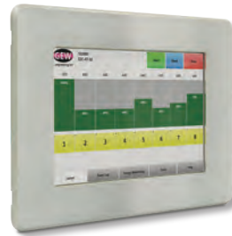
Die RHINO-Touchscreen mit dem Bedienfeld